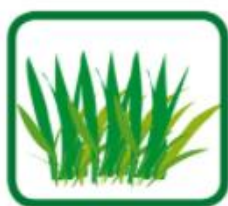
Tontes de gazon