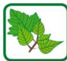
Feuilles, taille de végétaux