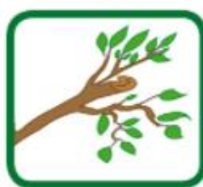
Branchages Ø maxi.15 cm