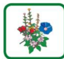
Plantes, végétaux flétris