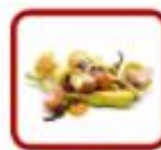
Déchets de cuisine